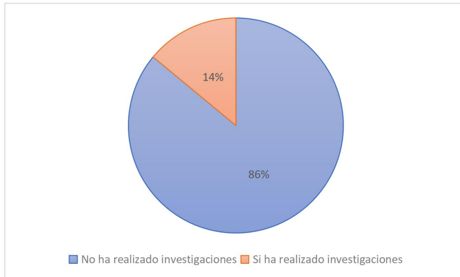
Fig. 2: Distribución de los estudiantes según la realización de investigaciones en el campo de la neurología

Resultados similares fueron encontrados en el estudio de Moreno Zambrano et al. (2013) en donde los encuestados calificaron la dificultad de la Neurología como la más alta de entre las ocho especialidades citadas en su investigación con una media estadística de 3.01 \pm 0.048 . Hallazgos como estos son de gran relevancia debido a la carencia de confianza y conocimiento, así como la percepción de complejidad, que podrían derivarse a la práctica perjudicando la calidad de atención y cuidado al paciente.