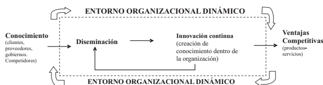
Diagrama 1 Relación conocimiento, innovación y competitividad

En este contexto de cambios internos y externos de las organizaciones, autores como Zorrilla (1997) plantean el surgimiento de la gerencia del conocimiento como el proceso de administrar continuamente conocimiento de todo tipo para satisfacer necesidades presentes y futuras e identificar y explotar conocimientos, tanto existentes como adquiridos que