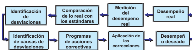
Gráfico N° 2 Sistema de Control de Acciones Correctivas

En este sentido y analizando el gráfico se puede concluir que por lo general se considera el control administrativo como un sistema de retroalimentación similar al que opera en los termostatos comunes. Es así como los administradores deben medir el desempeño real, comparar los estándares e identificar y analizar las desviaciones. Pero luego deben desarrollar un programa de acciones correctivas con el propósito de lograr el desempeño deseado, como se ejemplifica en el Gráfico N° 2.