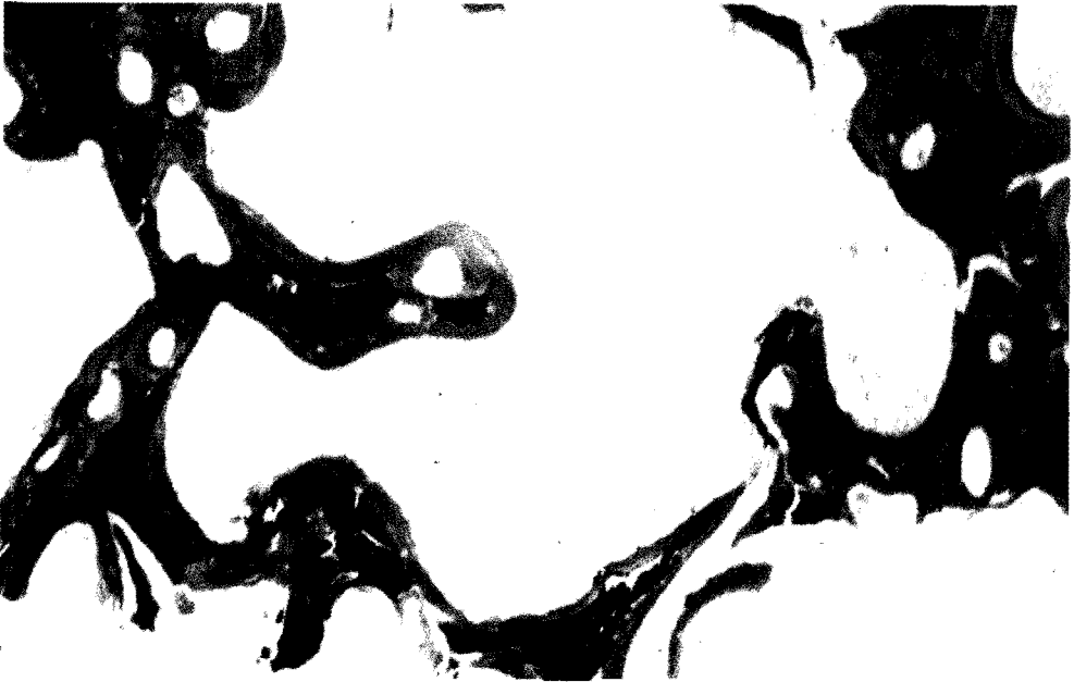
Fig. 1. Caso de osteodistrofia renal del Tipo II (Clasificación de Delling). Obsérvese la proliferación marcada de tejido osteoide o hiperosteoidosis (coloración rojiza) con reducción del hueso mineralizado (coloración negra). Modificación de Kossa descalcificado, 200 x.