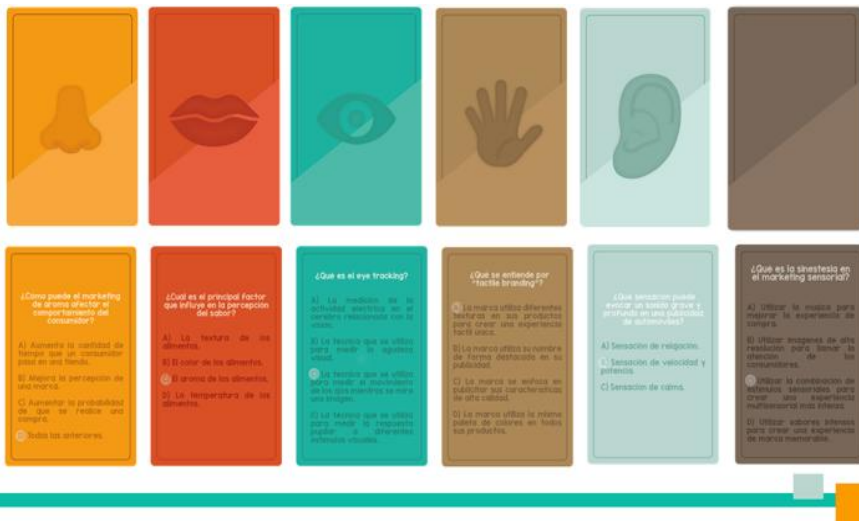
Diseño de tarjetas