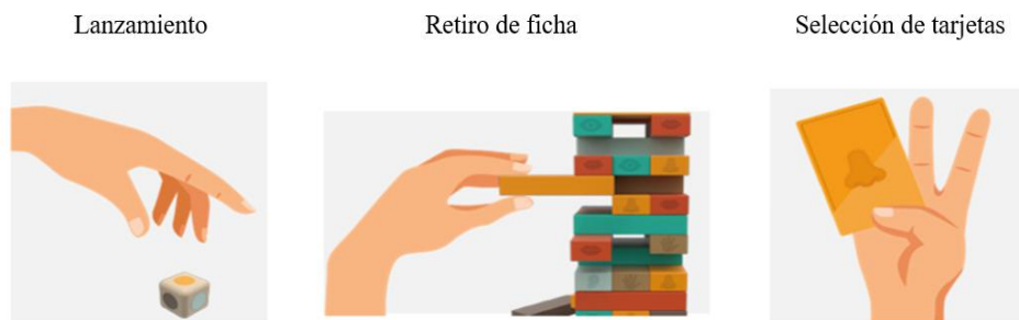
Secuencia de uso Market Sense.