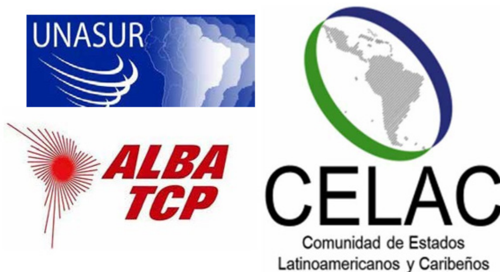
Fig. 1. Iniciativas de integración continental: UNASUR, ALBA-TCP Y CELAC.

pero que compartían la defensa de la soberanía nacional. Una correlación de fuerzas que fue revertida con la alternancia gubernamental que se produjo por los golpes de Estado, de viejo y nuevo tipo (parlamentarios o judiciales) y por las derrotas electorales de los gobiernos progresistas, afectando la arquitectura de estas instituciones multilaterales, la geopolítica contrahegemónica y el liderazgo regional venezolano.