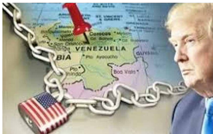
Fig. 3. Férreo bloqueo de Estados Unidos contra Venezuela

Desde el mundo académico y mediático se ha tratado de negar la existencia de un bloqueo a la economía venezolana (Fig. 3). Cuando se reconoce su existencia, se argumenta que, en realidad, ha sido una medida del último año o muy reciente. Sin embargo, el bloqueo contra la economía venezolana se puede rastrear hasta diciembre de 2014 con la Ley 113-278 aprobada por el Congreso de Estados Unidos. A ello se suman varias órdenes ejecutivas del Gobierno de Estados Unidos que constituyen decretos extraterritoriales para sancionar bien sea al Estado venezolano, a su industria petrolera o a